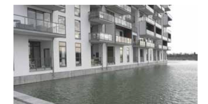
BOENDE VID VATTEN Referens: Studiebesök i Danmark